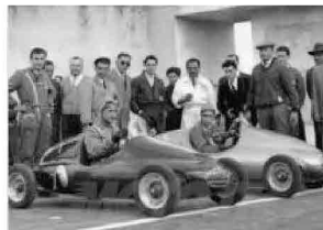
Due delle microcar Lambretta della Comerio a Monza

Tra le novità di ASIMOTOSHOW una microcar, mossa da un motore Lambretta 125cc prodotta dalla Comerio di Busto Arsizio. Si tratta di una piccola monoposto a ruote scoperte che esordì il 29 marzo 1950 a Monza. In un intervallo della Coppa Inter Europa, le piccole auto disputarono una corsa su un mini circuito guidate da giovanissimi piloti e il vincitore stabilì una media sul giro di 50 km/h! Ne furono costruite 12 quella che girerà a Varano è una delle pochissime sopravvissute.