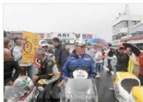
Phil Read, Varano 2011

Come tradizione i partecipanti saranno suddivisi in 15 batterie in funzione dell'età e delle caratteristiche della motocicletta, l'ultima batteria sarà riservata ai sidecar. I piloti scenderanno in pista per quattro volte, una volta il venerdì pomeriggio, due sessioni il sabato e una sessione la domenica mattina, si tratta di giri di pista senza carattere competitivo, su un circuito che si adatta molto bene a questo tipo di esibizioni.