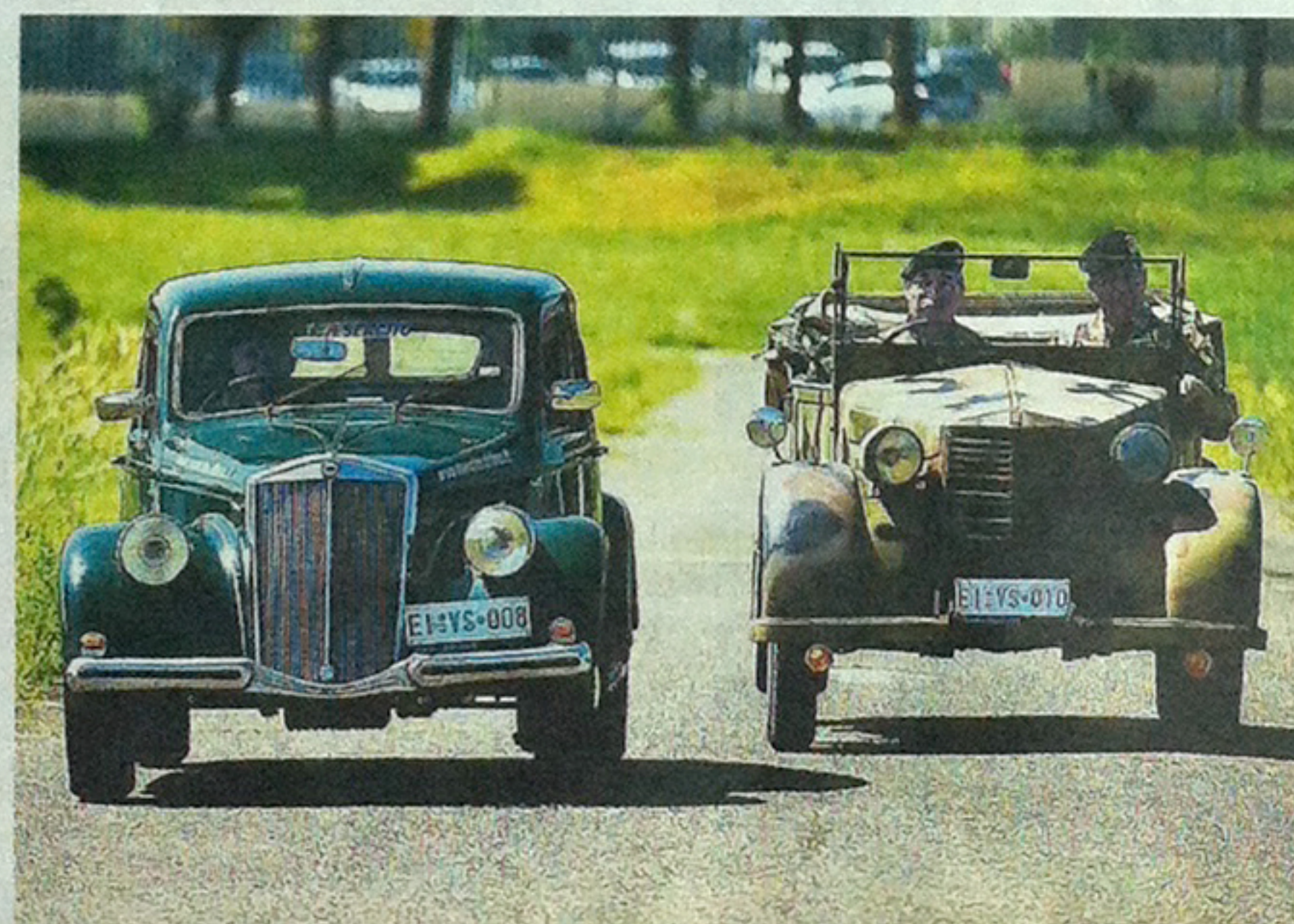
L'Esercito «correrà» con una Lancia Aprilia berlina del 1938 e una Fiat 1100 508 CM mimetica del 1939

Nel 1903 fu istituito poi un nucleo di militari addetti alla condotta di questi nuovi mezzi nell'ambito della brigata ferrovieri del genio. ●A.A.R.