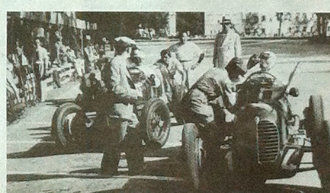
A fine anni '20 le auto si fermavano ogni 600 km per cambiare l'olio

Se oggi l'olio della macchina dura migliaia di chilometri prima di perdere la propria viscosità, bisogna ringraziare la Mille Miglia: manifestazione che vedeva impegnate tutte le case automobilistiche, laboratorio di ricerca affinché le prestazioni venissero sempre migliorate. Accadeva, a fine anni '20, che le auto dovessero fermarsi ogni 600 chilometri per effettuare il cambio dell'olio.